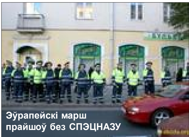
Эўрапейскі марш прайшоў без СПЭЦНАЗУ