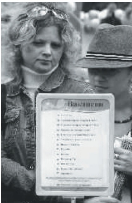
Жительница г.Смолевичи, в поисках работы, изучает предложенные вакансии.

иной срок по соглашению сторон Какой из этого можно сделать вывод? Боритесь за свои права. Закон не идеален, и работники также могут использовать его в своих интересах, как это активно делают наниматели.